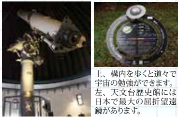
上、構内を歩く道々で宇宙の勉強ができます。左、天文台歴史館には日本で最大の屈折望遠鏡があります。

1914年、東京帝国大学（現在の東京大学）附属東京天文台が三鷹への移転。その時代に建設され残されて