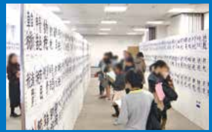
小学生の税の書道展

武蔵府中青色申告会は、昭和40年に設立されました。府中市・調布市・狛江市を中心とする個人事業主の方々の記帳・決算のサポートを行っています。会員数は約6000名以上で、都内有数の規模です。平成22年11月には公益社団法人に移行認定され、親子租税学習ツアー・小学生の税の書道展などの租税教育や、地域のイベントへの参加など、さまざまな啓蒙・社会貢献活動も行っております。