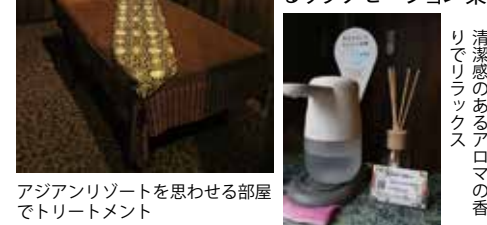
アジアリゾートを思わせる部屋でトリートメント

の人事担当を経て、夫婦での独立を決意することになりました。お互いのキャリアと強みを活かせるリラクゼーション業