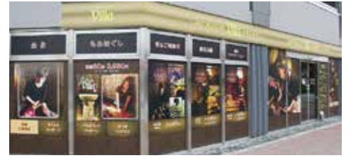
外観にはわかりやすい価格表が目につきます。価格帯はリーズナブル、その日の空き状況も店舗前で確認できます。